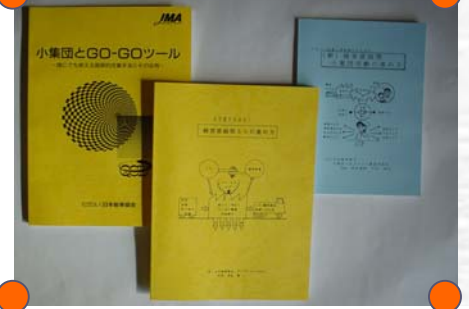
5S、並び、小集団活動マニュアル